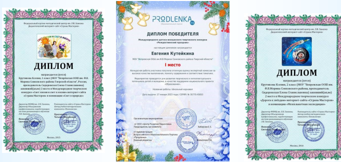
Успехи в олимпиадах