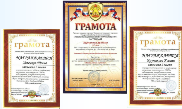
Участие учеников в конкурсах