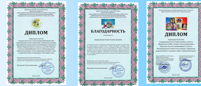
Грамоты «Страны мастеров»

Личный пример учителя- это и есть мотивация к знаниям